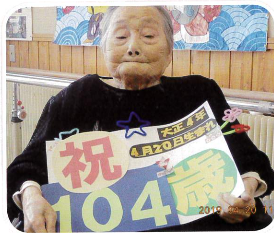
長生きの秘密はなんでしょう??