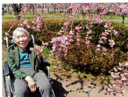
桜と一緒にハイポーズ