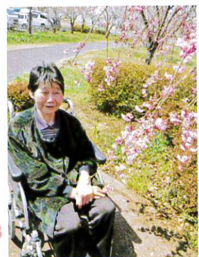
きれいに 撮ってけい