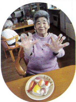
まんまる キレイな できあがり No.1