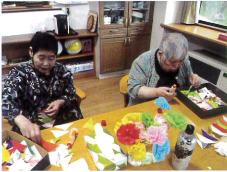
飾り作りなら 私たちに任せて♪