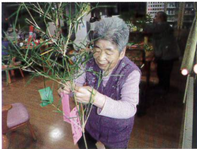
さーさーの一葉 さーらさー♪