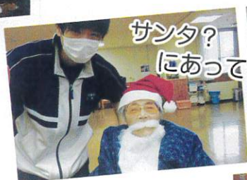
サンタ? にあってるが?