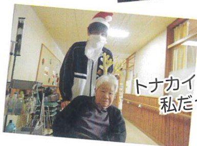
トナカイは 私だっが?