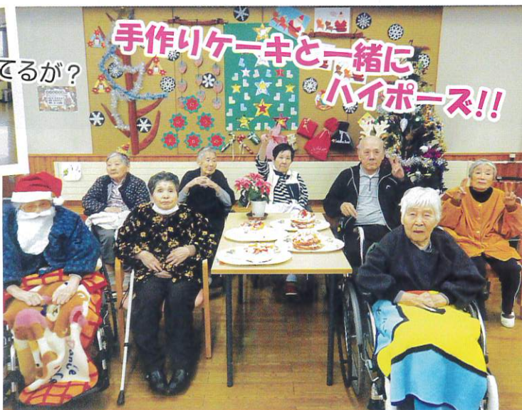
手作りケーキと一緒に ハイポーズ!!