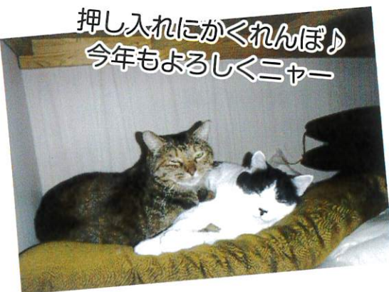
押し入れにかくれんぼ♪ 今年もよろしくニャー

今年も豆まき、恵方巻作りを行いました。 豆を投げて鬼が去っていき、皆さん一安心。 テーブルをつなげて長い恵方巻を作り、おいしく頂きました。お腹いっぱい満足された様子でした。 福を招いて良い一年になりますように！