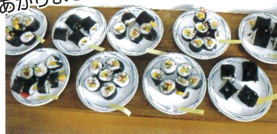
おいしそうな恵方巻が できあがりました!!