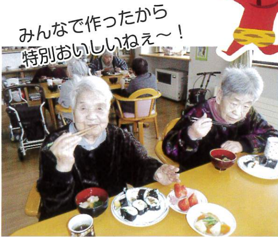
みんなで作ったから 特別おいしいねえ~!