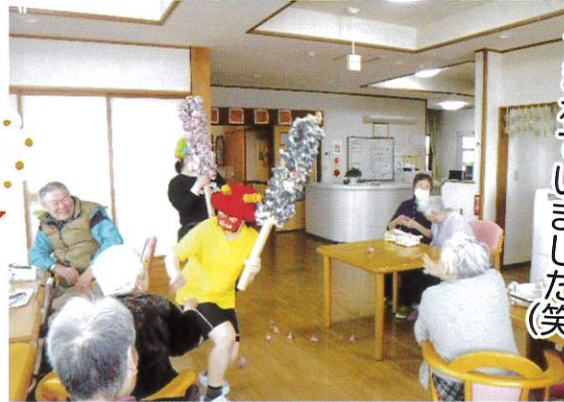
終始笑いに 包まれていました(笑)