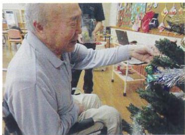
どれっ オレも手伝うが？