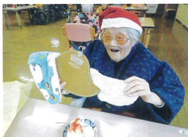
プレゼント もらったぞ♪