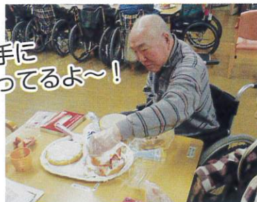
上手に 作ってるよ~!