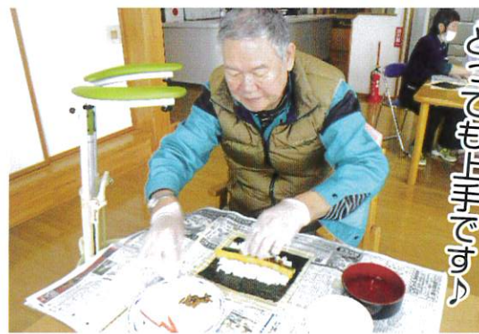
具がはみ出さない ように... とこどもも頑張る