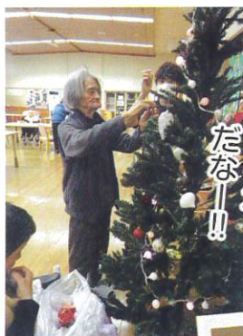
大きなもみの木 だな！！