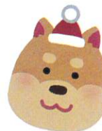
甘いの だーいすき♪