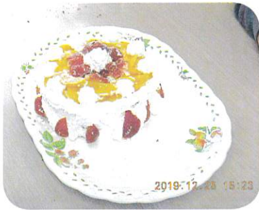
今年のサンタさん いっぱい来たよ