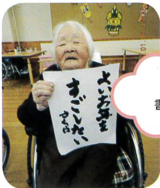
上手く 書けました!

一月十日に新年会を行いました。カラオケをしたり、書き初めをしたり、楽しい時間を過ごしました。利用者さん達はさすがと言うほど、筆使いがすばらしいです。やはり硬筆より毛筆の方が慣れていらっしゃるようです。職員も見習って練習頑張ります。