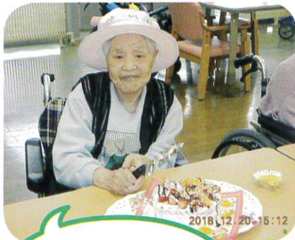
実は12月20日は 私の誕生日なのデス!!