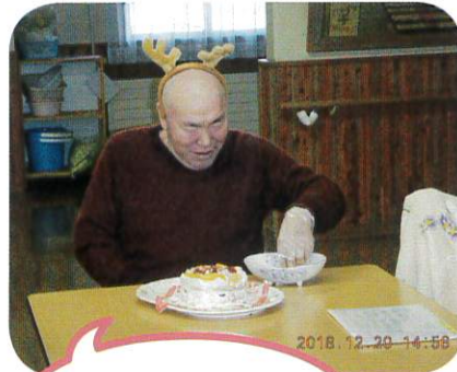
男だって、 パティシエになるんだぞー