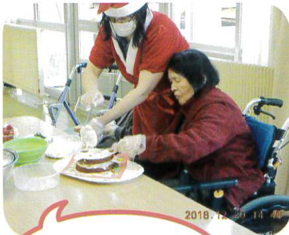
サンタさんと ケーキ作りしました