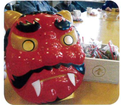
今年も豆まき・恵方巻作りを行いました！