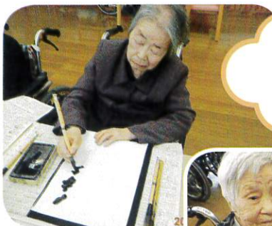
見よ!! この筆さばき!!