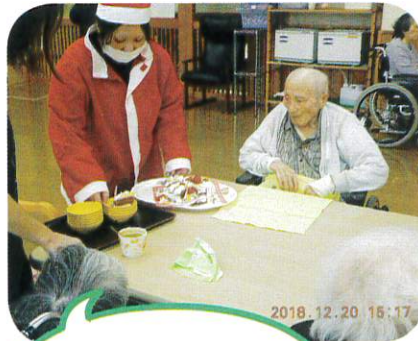
サンタからの プレゼントですよー