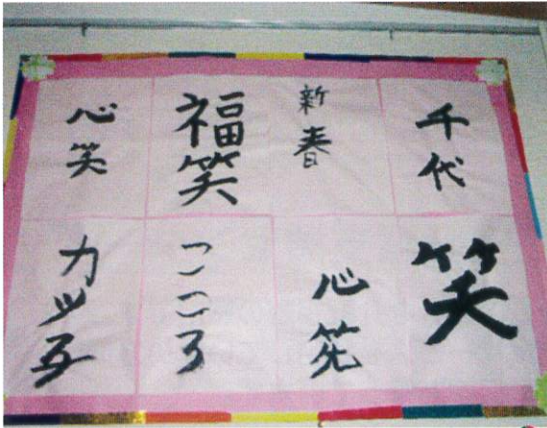
思い思いの書き初め