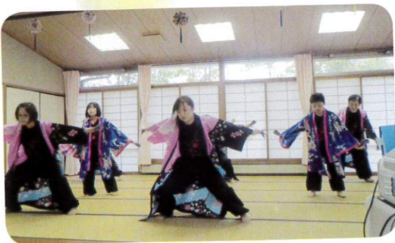
Rock桜舞の皆さんは キレッキシのよさこいでした