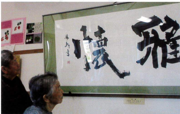
デイサービスセンターにある「雅懐」