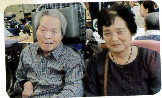
職員は ゆつたり系~