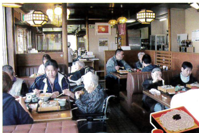
黙々と食べています!