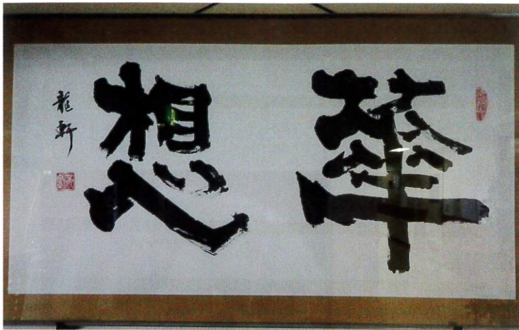
慶泉荘の玄関にある「華想」