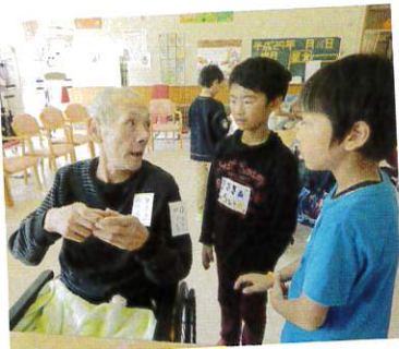
昔の話も聞いてけろー