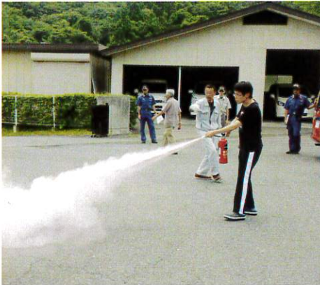
消火器の実技体験

七月十二日に夜間想定避難訓練を行いました。消防署の方に来荘して頂き、指導してもらいました。夜間の勤務は介護職員二名と当直一名での勤務なので、三名での避難が開始されました。その後、駆けつけてくれた地域住民の方も消火班・誘導班に分かれ、迅速に避難誘導が行われました。実際の火災でも訓練同様に冷静で的確な行動が出来るように心がけたいです。