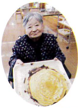
ジャンボどら焼き 出来ましたー

三月二十五日、おやつ作りを行いました。メニューは皆さん大好きなどら焼きです。ホットプレートを使用して、生地から手作りしました。甘い香りで、食堂がいつぱいになると皆さんの食欲もかきたてられ、「まだかなあ」と言われています。温かい生地にあんこを挟んで出来上がりです。自分で作ったものは尚美味しいもので、皆さん完食でした。「また食べたいね」とリクエストの声がきかれていました。