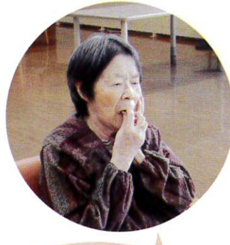
美味しくて、 ほっぺが落ちちゃう