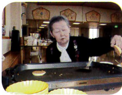
慶泉荘のパティシエ