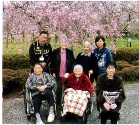
満開の桜にうっとり♪