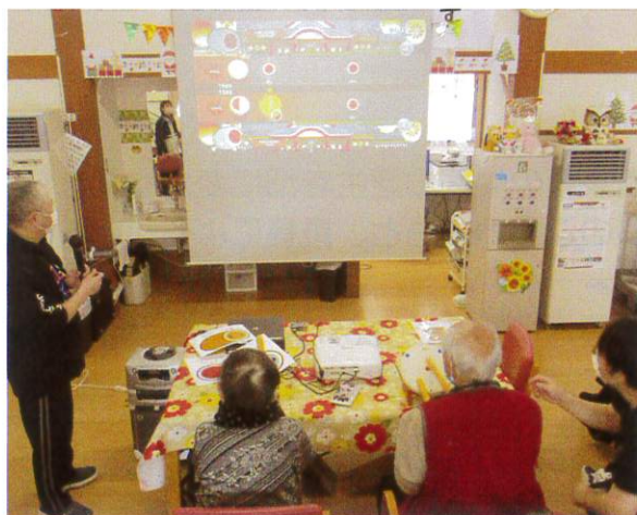
（上写真は昨年末のレクリエーション活動の様子）

当法人でも昨年末に日本アクティビティ協会様御協力の元、プレイステーション4の太鼓の達人を使ったレクリエーション活動（ゲーム大会）を行っております。