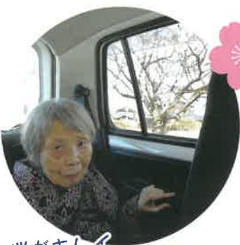
縦がキレイ だっちゃんね。