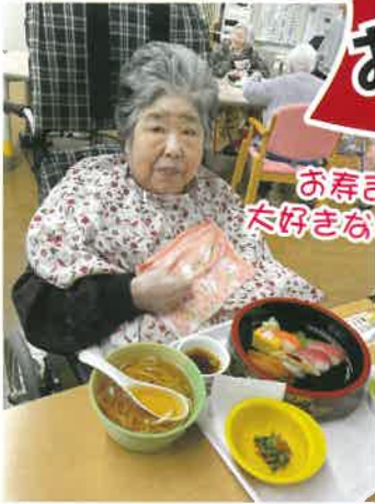
お寿司 大好きなのよ

ひな祭りの日、慶泉荘にお寿司屋台がやってきました。皆さんそれぞれ好きなネタを選んで、目の前で握ってもらっています。美味しそうですね。