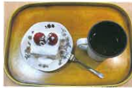
いちごの♡ ショートケーキ