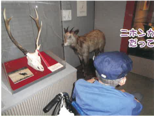
ニホンカモシカ だつてえ?