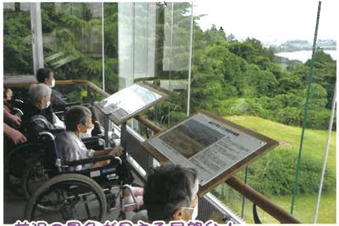
前沢の景色が見える展望台! 悪車も見えるちゃ!