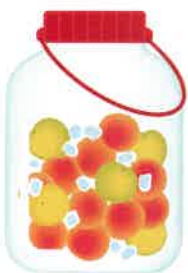
今年の梅の実、大きっちゃね～。