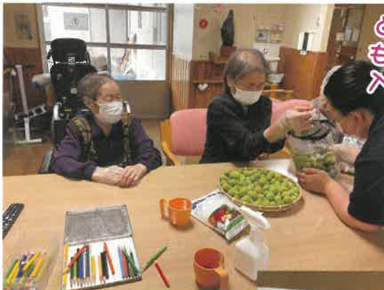
どうだべ～。もうちょっと入れてみる？