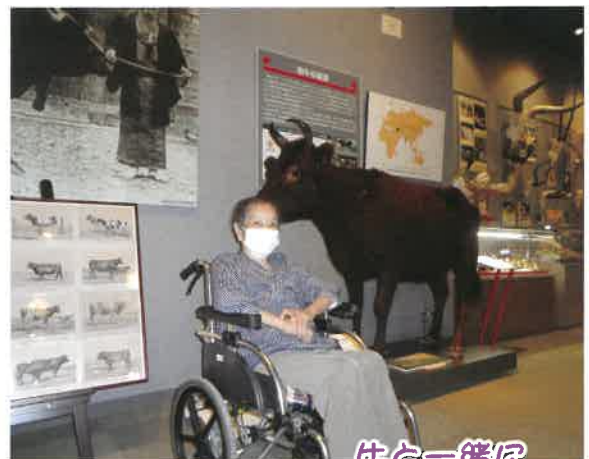
牛と一緒に バシヤリ!