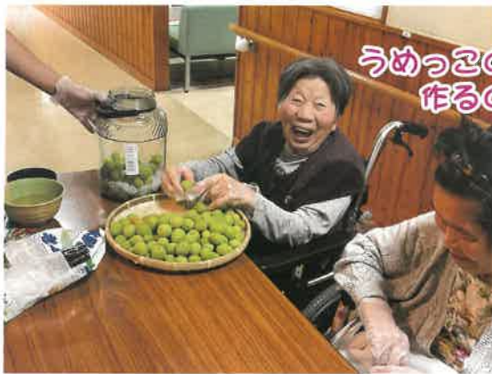
うめっ子のシロップ作るのが？